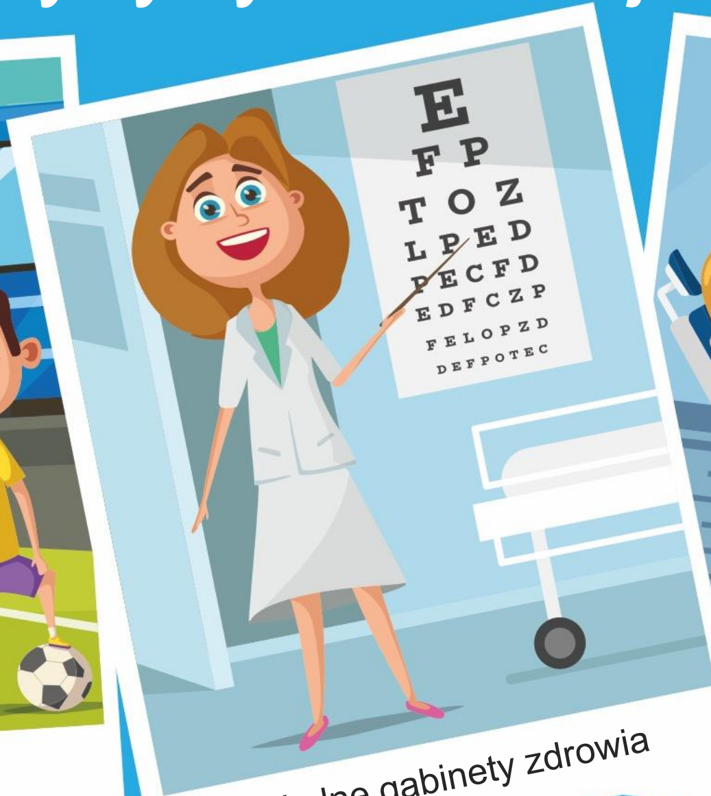
Szkolne gabinety zdrowia